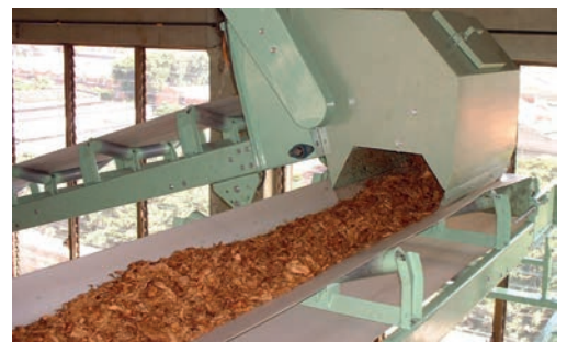
E - Transportadores planos - VERNA 12PF, VERNA 12PF - VERNA 20PF - VERNA 30PF.