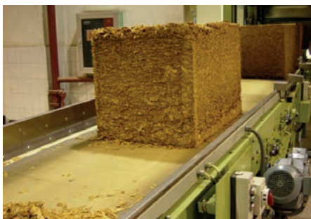
A - B VERNA 20PF Transporte de balas de tabaco C - Transporte inclinado de las hojas

Para detectar la presencia de estos elementos, se realiza el Test de la pirólisis , por el cual se somete a combustión ( 810° C ) una muestra de banda. Del gas obtenido, se analiza el porcentaje en peso de los elementos citados.